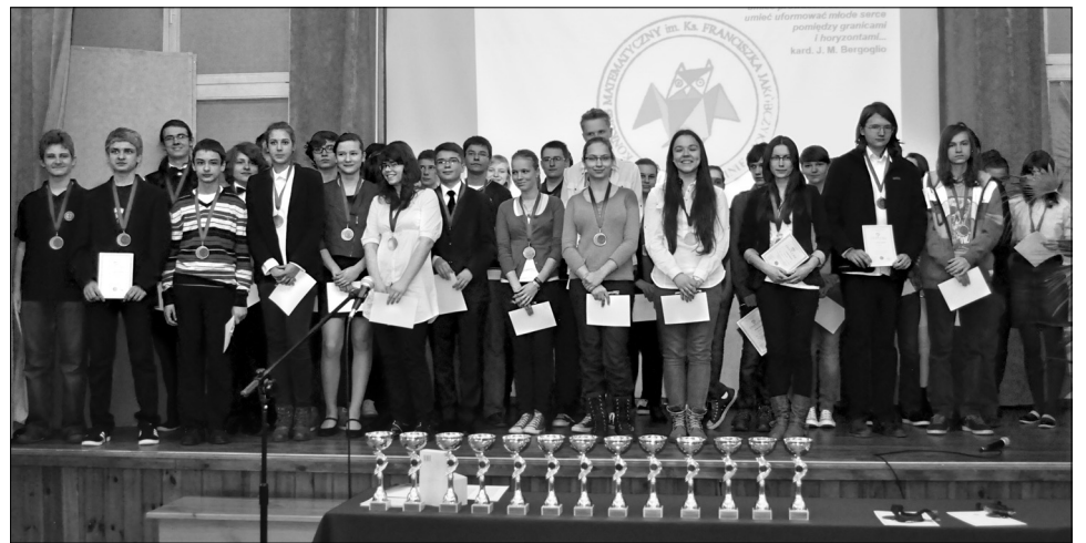
Laureaci XVII edycji